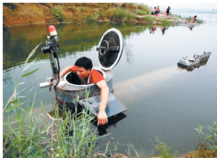
Лодка уже прошла испытания в водах местного озера.

Две палатки. Ночь. Холод. Голод. Из первой кричат во вторую: - Мужики, колбасу с водкой есть будете? Мужики из второй, стуча зубами, выскакивают из спальных и бегут к первой, крича: - Будем, будем! В первой отзываются: - Когда будете, нас позовете!